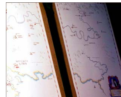
Detail van de schets.

Wie anders dan de aanwezige gasten kunnen deze kaart waarop de wereld van de jubilarissen zo fantastisch is afgebeeld beter van informatie voorzien? Zij worden uitgenodigd om onder begeleiding van het team van Martijn Kessler hun eigen plek op het