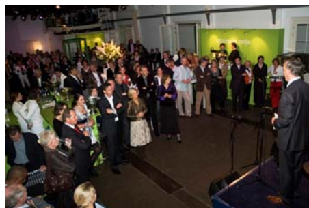
Een feest ter gelegenheid van een jubileum.

Een bijzondere manier om een feest ter gelegenheid van een jubileum of een bruiloft van een kunstzinnig en zeer persoonlijk accent te voorzien is het ter plekke in kaart laten zetten van het proces wat heeft geleid tot deze speciale gebeurtenis. Een ludieke spiegel van een levensloop of carrière. Het DNA van de feestvarkens in landkaartvorm. Een bijzonder en subtiel kunstwerk van de bekende kunstenaar-geoficticus Martijn Kessler(1958).