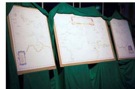
Een monumentale, mooi geïllustreerde schets in landkaartvorm.

zelf worstelt de levensloop van de jubilarissen zich door een fantasielandschap.