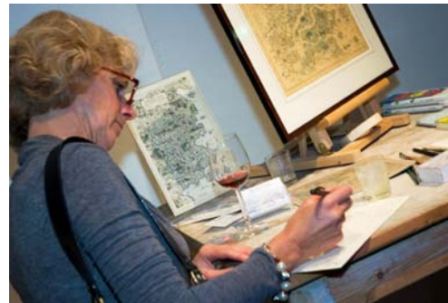
Gasten kunnen relatief discreet en in alle rust anekdotes over de jubilarissen op de daarvoor bestemde documenten beschrijven.

anekdotes over de jubilarissen kunnen beschrijven. Deze worden later door het team van Martijn Kessler vertaald in geografische symboliek en in de kaart verwerkt.