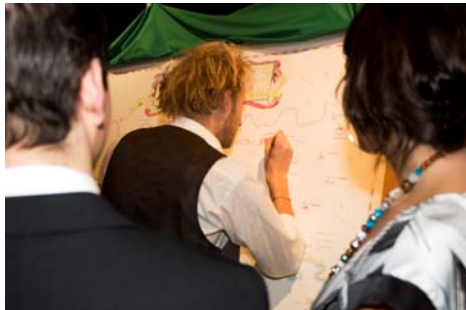
De gasten worden uitgenodigd om hun eigen plek op het levenspad van de jubilarissen aan te geven.

levenspad van de jubilarissen in te vullen. Zo hebben zij een directe invloed op het tot standbrengen van de levensloopkaart. Behalve dat de jubilarissen op een speelse en zeer originele manier een fantastisch cadeau krijgen gepresenteerd worden de aanwezige gasten geanimeerd met de meest opvallende gezamenlijke herinneringen. Zij worden geïnspireerd de bijzondere momenten die zij samen met de jubilarissen hebben gedeeld op de kaart te vereeuwigen.